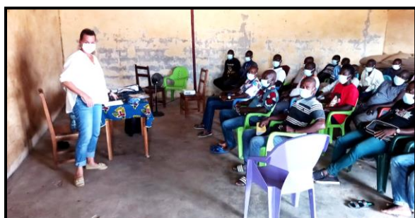
Séance de présentation du projet Pro-Planteurs à la CAUD

En se référant à la matrice des résultats du projet, qui proposait initialement d'atteindre un certain nombre d'indicateurs pertinents, et en s'appuyant sur les recommandations des différents prestataires des activités de la phase 1 du projet, des critères pertinents de sélection des sociétés coopératives ont été élaborés en concertation avec les partenaires du projet et validés par le Comité Technique de Coordination (CTC). Fort des leçons apprises lors de la phase 1, l'équipe du projet a souhaité cibler précisément les sociétés coopératives légalement constituées et fonctionnelles, aptes à pouvoir mettre en œuvre les approches du projet. Elle a également exprimé le souhait de renforcer la participation et l'implication des dirigeants des sociétés coopératives partenaires dans la phase 2 du projet.