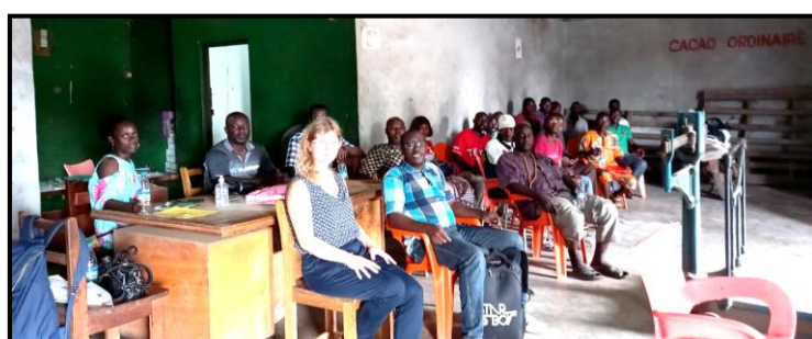
Séance de présentation du projet Pro-Planteurs à la SOCABA