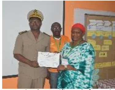
Remise des certificats de formation par le Préfet de Divo