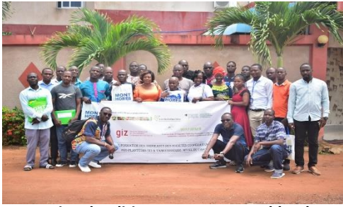
Formation des dirigeants et responsables des sociétés coopératives à Yamoussoukro