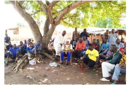
Séance de duplication des formations aux membres dans une section

Il faut noter en plus du renforcement des capacités des dirigeants et responsables des sociétés coopératives, ces différentes formations sont dupliquées aux membres des sociétés coopératives dans leurs différentes sections ; ce qui permet à l'ensemble des membres de mieux s'approprier la notion de coopérative et de comprendre leurs responsabilités et leurs droits au sein de ces structures.